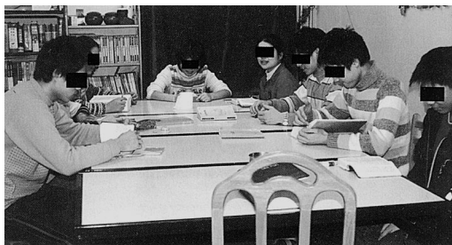
Seminář čínské domácí církve, který sponzoruje Hlas mučedníků