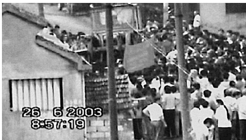
Buldozer strhává budovu kostela, který kdysi vystavěla ještě misie Hudsona Taylora.