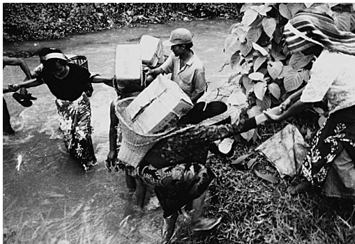
Čínští křesťané nesoucí evangelia do odlehklých oblastí musejí s těžkým nákladem přebrodit řeku.

Titto příslušníci kmene Khmu nemají co ztratit. Jméno jejich kmene znamená „otrok“. Odjakživa žili v pohrdání. A tak mají křesťané to-