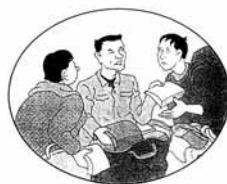
◎ 魏某积极参加邪教活动，又欺骗他人。还跑到外地散发邪教传单。

Překlad bodu III.: Toto shromáždění nebylo legálně registrováno nebo schváleno úřadem pro náboženské záležitosti. Je to místo ilegálních náboženských setkání, které hrubým způsobem narušuje veřejný pořádek a normální život obyvatelstva. Proto se zde přísně zakazují jakékoli další náboženské aktivity.