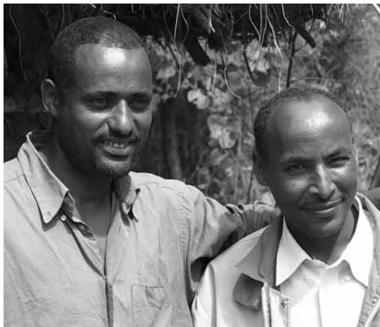
- Hlas mučedníků, USA, únor 2006

Kanadská kancelář Hlasu mučedníků již připravila projekty na pomoc pronásledovaným křesťanům v Etiopii, které zahrnují biblické semináře, tisk křesťanské literatury, finanční pomoc pro tamní křesťany a tisk Bible v jazyce prostých lidí (Bible, kterou používá etiopská pravoslavná církev je v jazyce, kterému již dnešní Etiopané rozumějí jen s velkými obtížemi). Modleme se za etiopské křesťany, aby setrvali ve své věrnosti Kristu i navzdory pronásledování.